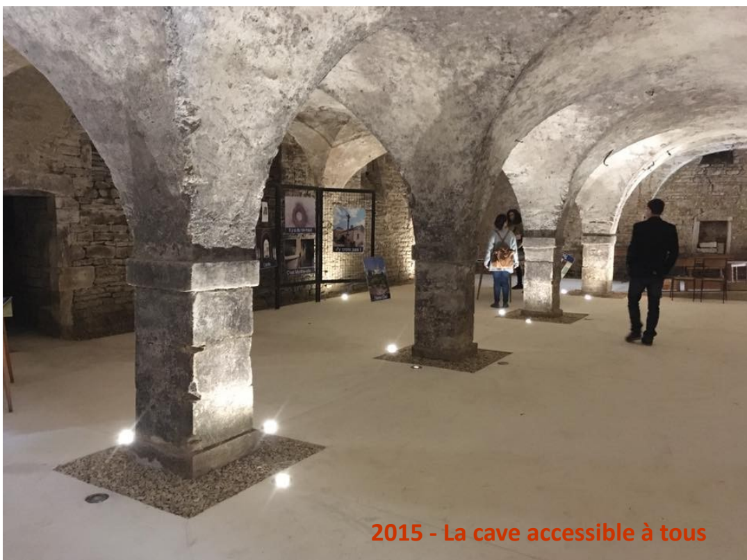
2015 - La cave accessible à tous