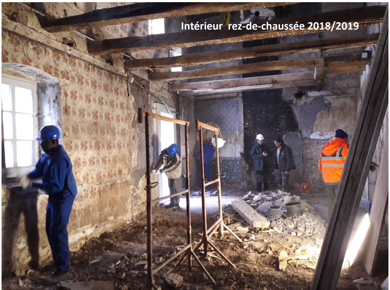
Intérieur rez-de-chaussée 2018/2019