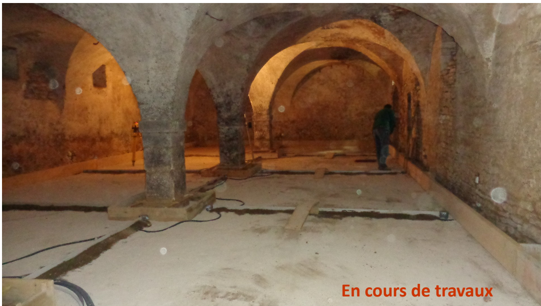
En cours de travaux