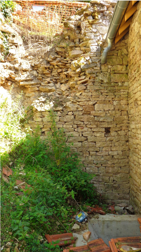
2014 - Arrière maison et mur de soutènement du traje