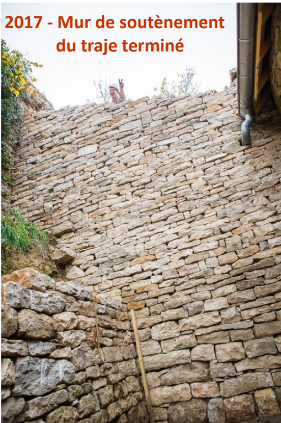
2017 - Mur de soutènement du traje terminé