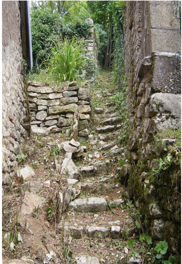
2019 - Première partie du traje terminée