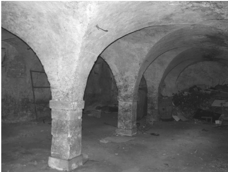
La cave en 2009